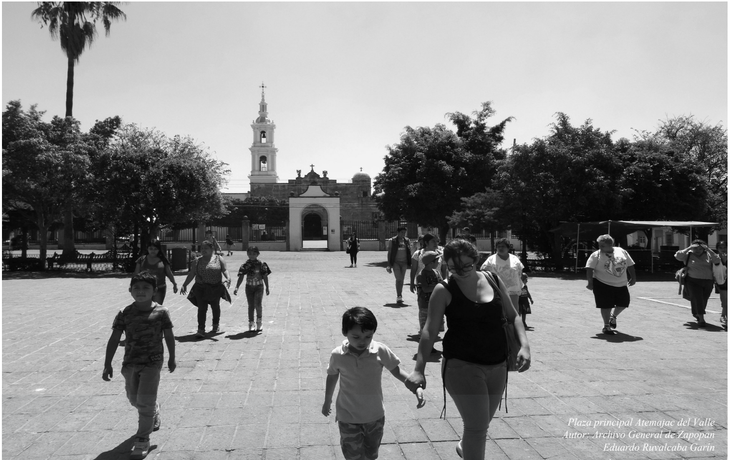
Plaza principal Atemajac del Valle

GUÍA TÉCNICA, GUÍAS EJECUTIVAS Y BITÁCORAS DEL REGLAMENTO DE GESTIÓN INTEGRAL DE RIESGOS DEL MUNICIPIO DE ZAPOPAN, JALISCO.